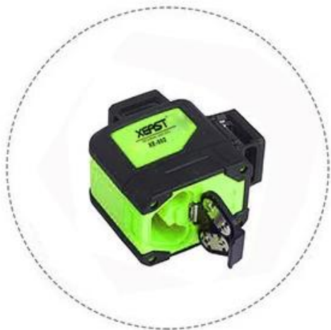
Low battery capacity indication with Laser lessens