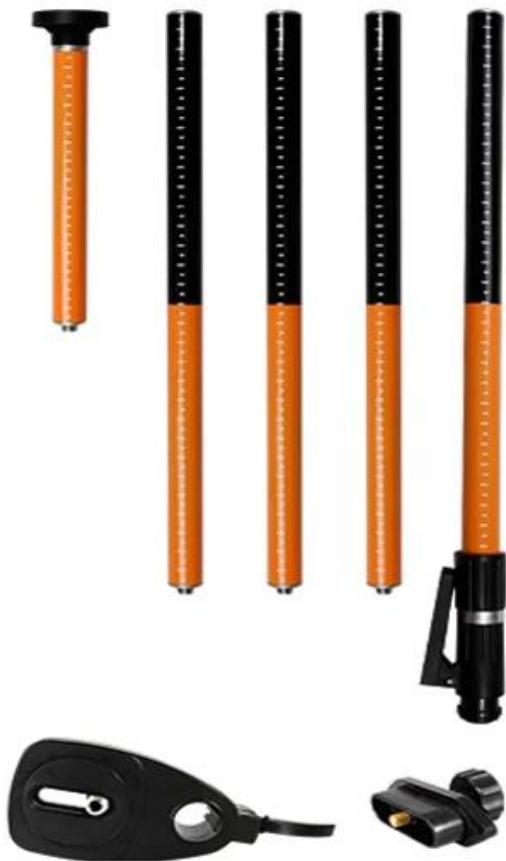
5/8 threaded interface