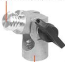
5/8 threaded interface