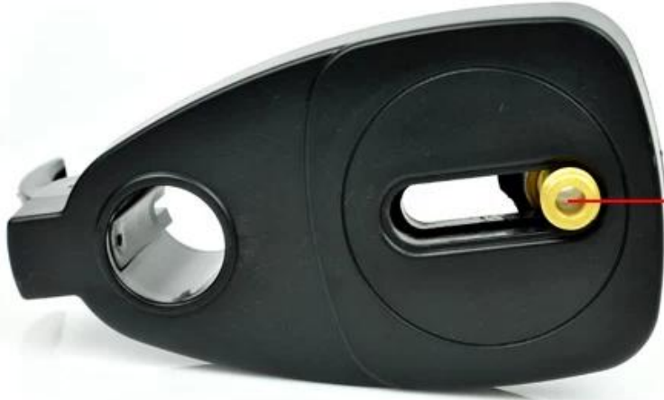
5/8 threaded interface