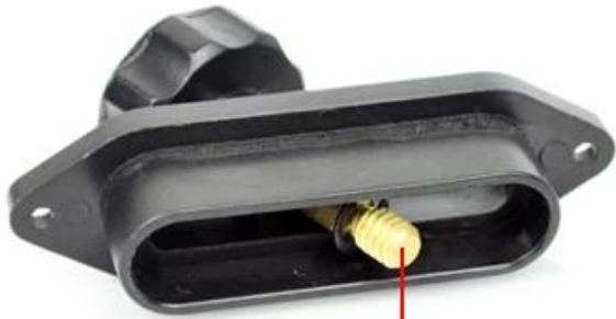
1/4 threaded interface