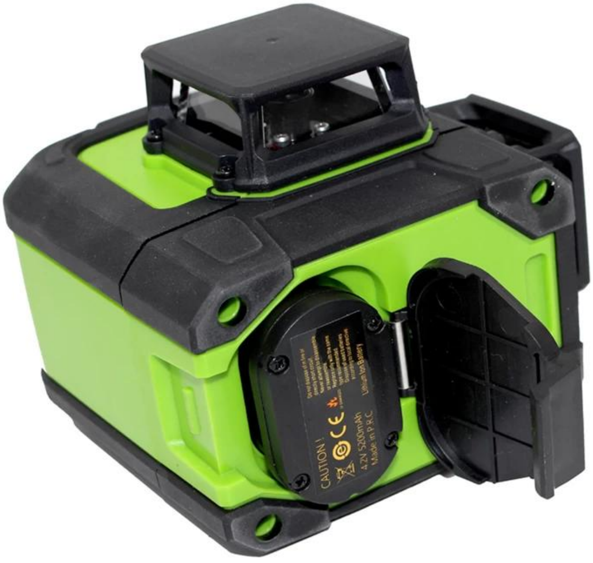
La batteria agli ioni di litio