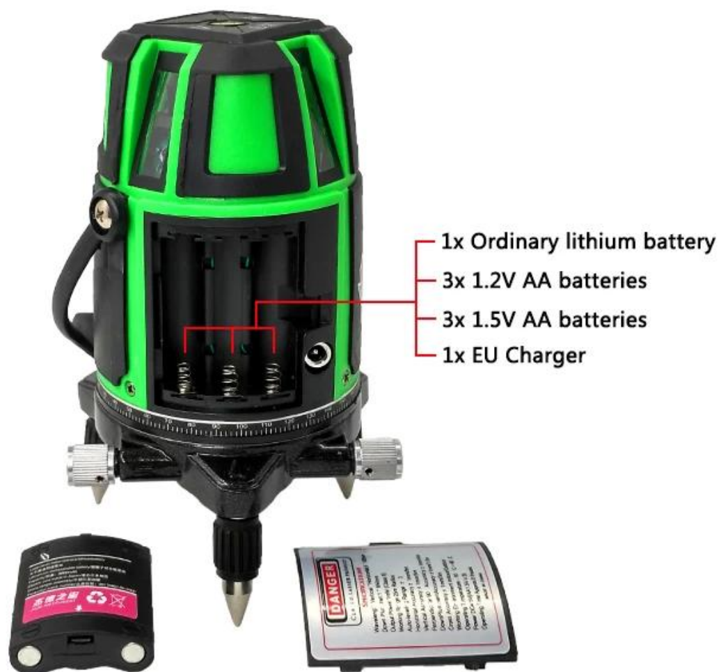
Ordinary lithium battery